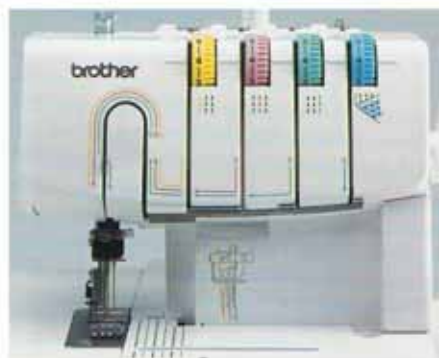
Système d'enfilage simplifié Guide-fil avec code couleur