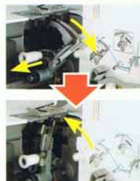
Enfilage rapide du boucleur inférieur