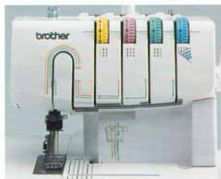
Système d'enfilage simplifié Guide-fil avec code couleur