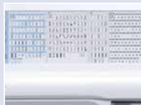
Tableau de référence des points pour visualiser rapidement les 294 fonctions de couture.

Système d'enfilage de l'aiguille automatique.