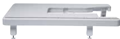
Table d'extension large

Transparent et marqué de repères, son action à ressort permet de passer diverses épaisseurs de tissus.