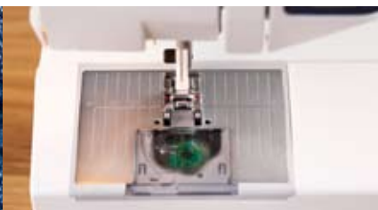
Plaque à aiguille avec deux lignes de guidage étendues.