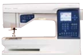
SAPPHIRE™ 870 QUILT