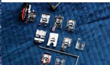
Comporte des pieds-de-biche à fixation immédiate et accessoires pour faciliter la couture de techniques spéciales.