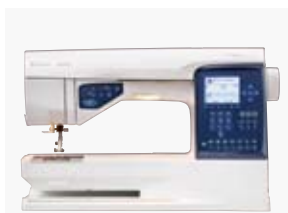
SAPHIRE™ 870 QUILT